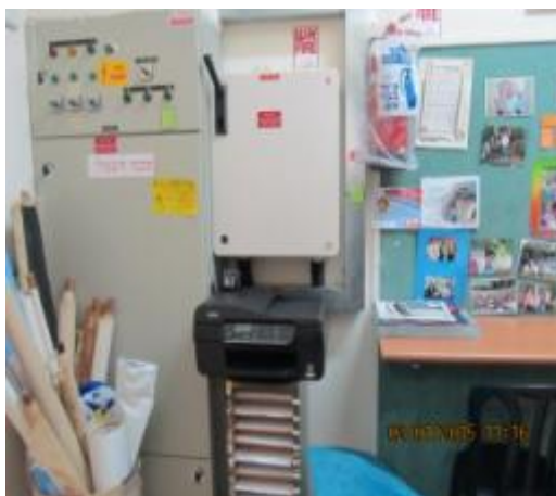
תמונה 2 : אולם הגן